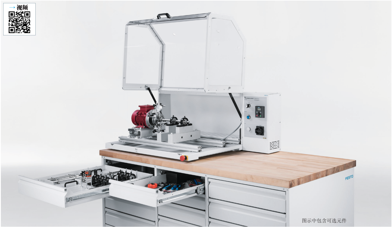
图示中包含可选元件